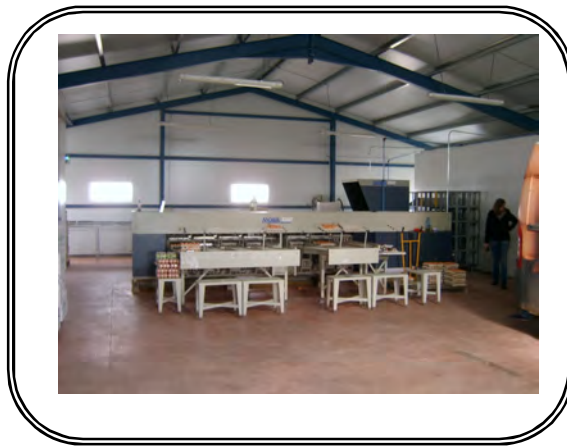
Centro de calcificación y embalaje de huevos camperos