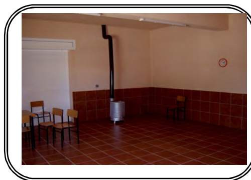
Centro Social en Tardajos