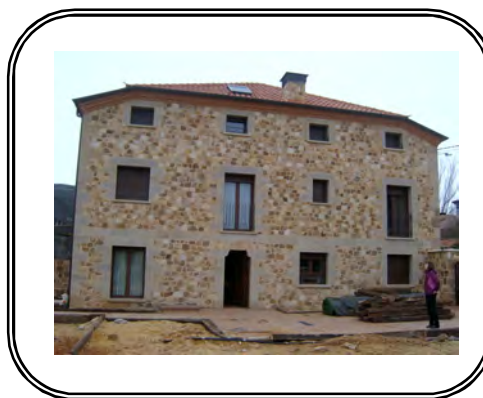
Hotel Residencia en Santervas de la Sierra