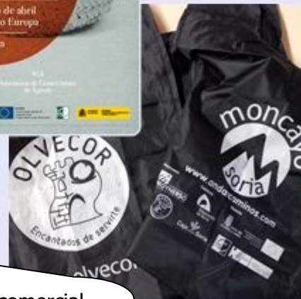
Plan de dinamización comercial del Moncayo